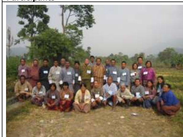
CFMG of Gathia WUA