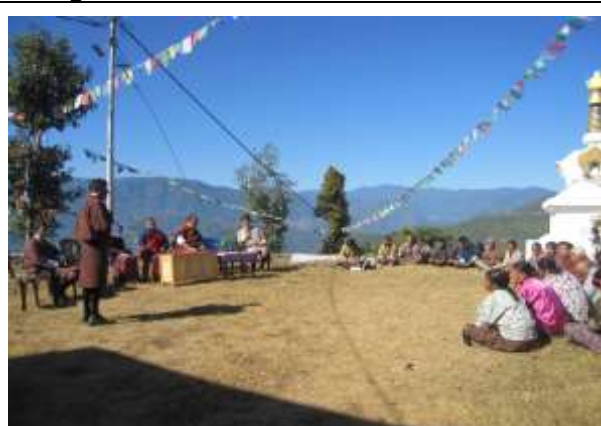
Review and planning workshop