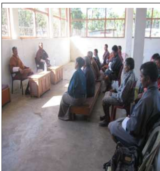
Chuzagang CSA beneficiaries on reviews and planning