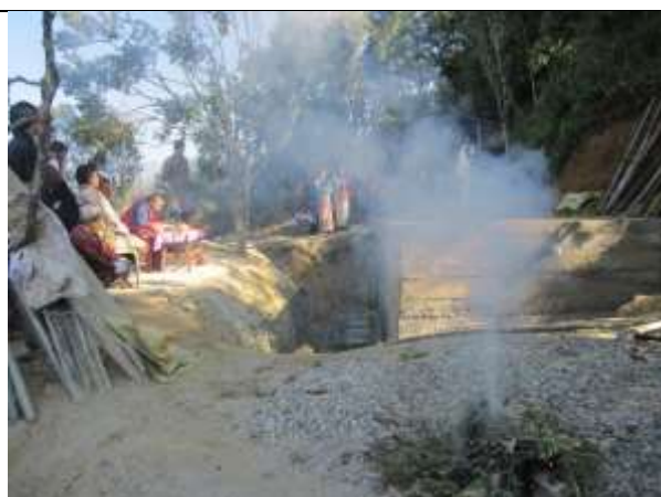
inauguration of water tank